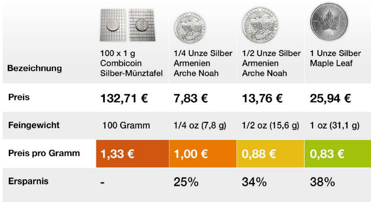
Schaubild 5: Keine Combibars oder Combicoins kaufen

Wer unseren Ratgeber zum Thema „Gold kaufen“ kennt, weiß, dass wir großes Fans vom Combibar sind. Aber nicht bei Silber: