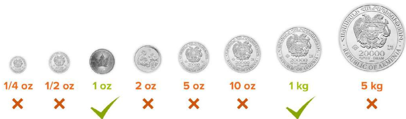
Schaubild 6: Keine Zwischengrößen kaufen

Marktstandard bei Silbermünzen ist mit weitem Abstand die eine Feinunze, als rund 31,1 Gramm Feinsilber. Gefolgt von der 1 kg Silbermünze. Alle anderen Gewichtsklassen sind eher als Exoten einzustufen.