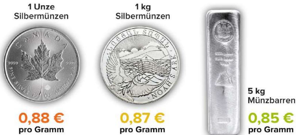
Schaubild 4: Münzbarren statt Silberbarren

Münzbarren sind quasi differenzbesteuerte Silberbarren. Nicht immer, aber oft ist der Preis pro Gramm bei ihnen günstiger als bei Silbermünzen. Sie erhalten also auch hier beim Kauf mehr Silber für ihr Geld.