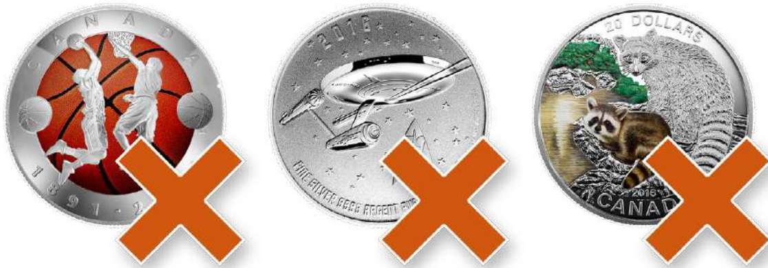
Schaubild 9: Keine colorierte Münzen und Sondereditionen kaufen

Ohne Zweifel: Colorierte Münzen sind schön anzusehen und haben auch ihre Daseinsberechtigung, wenn Sie diese als Sammler kaufen. Nicht aber, wenn Sie Silberinvestor sind: Colorierte und andere Sammlermünzen sind immer teurer als Anlagemünzen, wie Maple Leaf und Co.