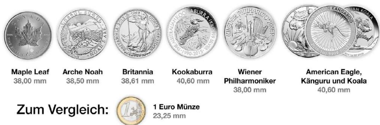
Schaubild 7: 1 Unze Silbermünzen - Größenvergleich

Wenn Sie zur Krisenvorsorge \frac{1}{4} oder \frac{1}{2} Unzen Silbermünzen kaufen möchten, ist dies ok. Aber nicht, wenn man möglichst viel Silber fürs Geld und später möglichst viel Geld fürs Silber haben will. Wägen Sie daher ab wie viele kleine Münzen Sie tatsächlich brauchen.