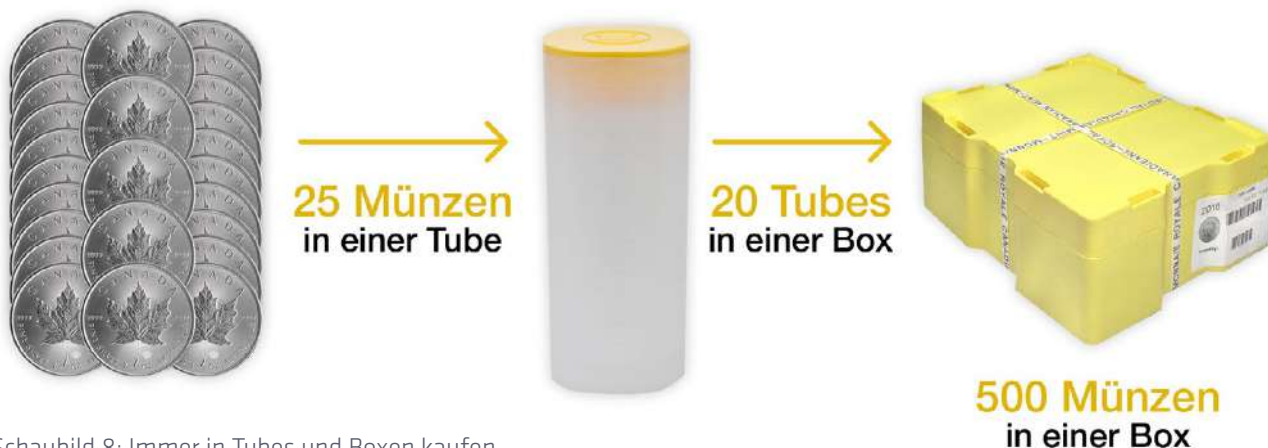
Schaubild 8: Immer in Tubes und Boxen kaufen

Zwar nicht alle Silbermünzen, aber zum Beispiel Maple Leaf, Arche Noah und die Känguru Silbermünzen werden in so genannten tubes, das sind stabile Plastikrohre, und mehrere solcher tubes in so genannten Masterboxen verpackt.