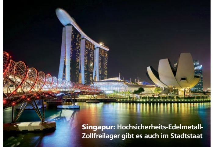
Singapur: Hochsicherheits-Edelmetall-Zollfreilager gibt es auch im Stadtstaat